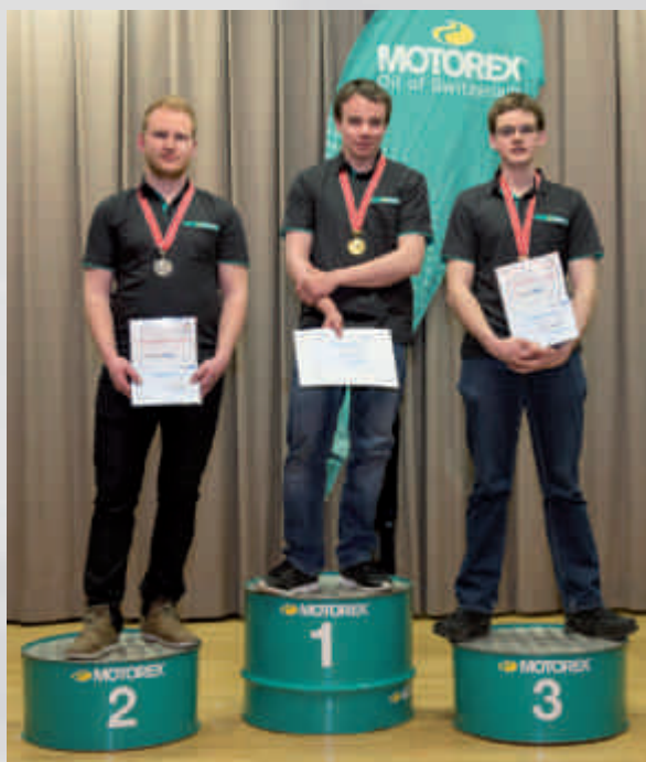
Die letztjährigen Gewinner bei der Siegerehrung in der «Krone» in Aarberg.

le podium 2015, pendant la cérémonie de la remise des prix au restaurant «Krone» à Aarberg