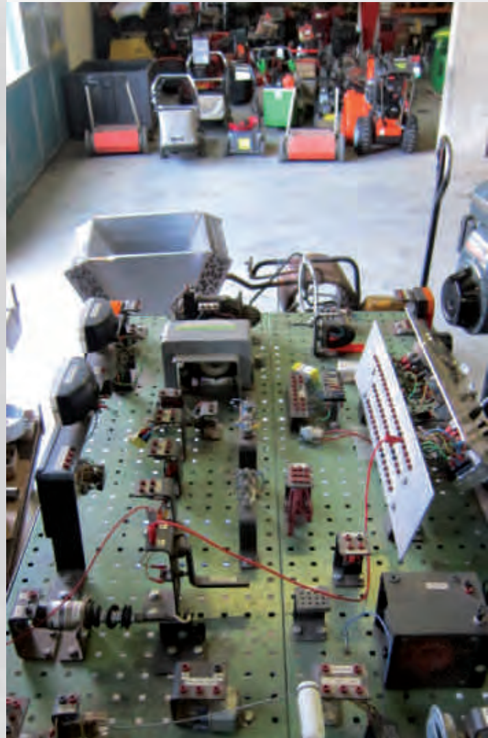
Übungsobjekt am Ausbildungsplatz.