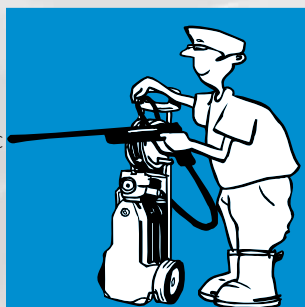
Entretien: entretien de l'intérieur et de l'extérieur avec des appareils et des outils