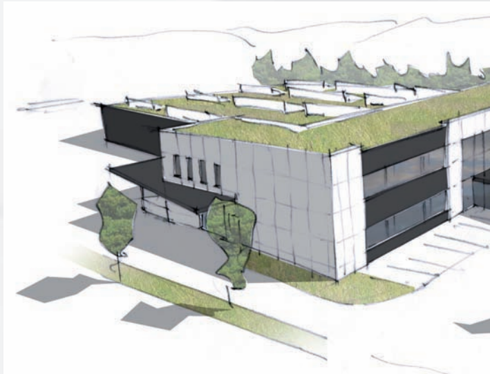
ab/à partir de 1.1.2012 Müslistrasse 43, 8957 Spreitenbach

Nous sommes impatients de vous servir plus efficacement dans notre nouvel emplacement à partir du 1 er janvier 2012.